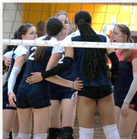
LE SPORT FÉMININ