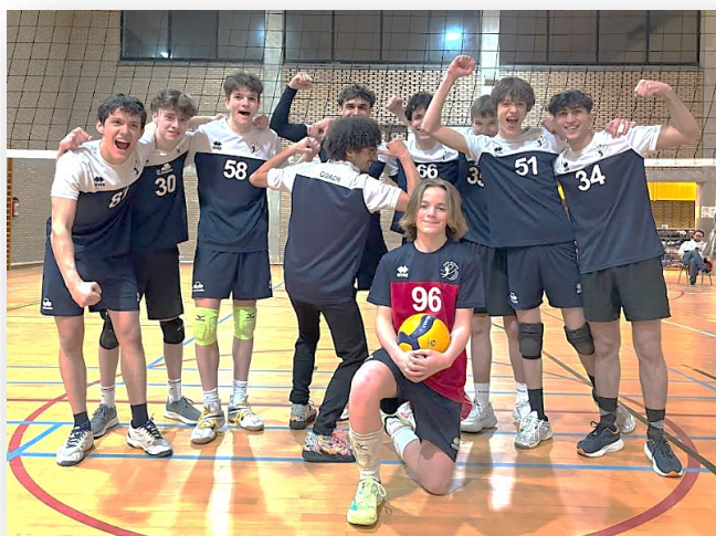
LA FORMATION DES JEUNES (FILLES ET GARCONS)