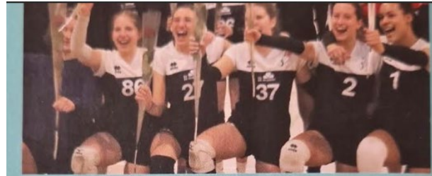
Force Media Volley