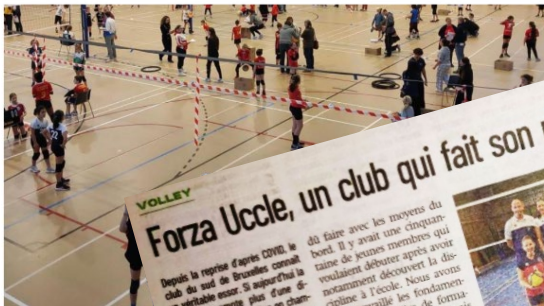
Un événement qui rassemble - Forza Uccle

Le club bruxellois a fait de la jeunesse la pierre angulaire de son projet sportif depuis plusieurs saisons. C'est donc tout naturellement que l'entité de la capitale accueille ce dimanche une manche de la fun cup dédiée au jeune public.