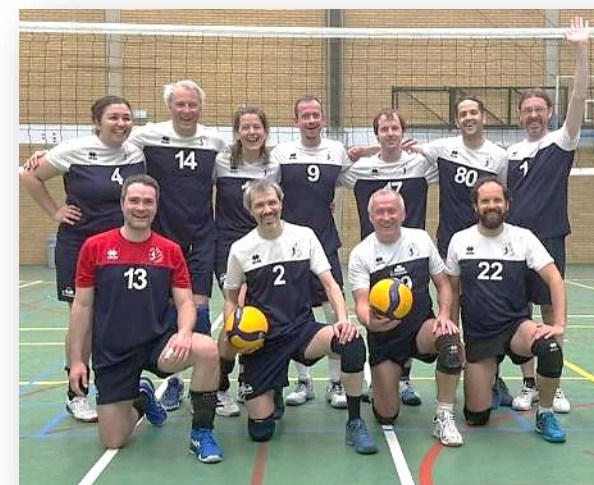
LE SPORT POUR TOUS & POUR LA VIE